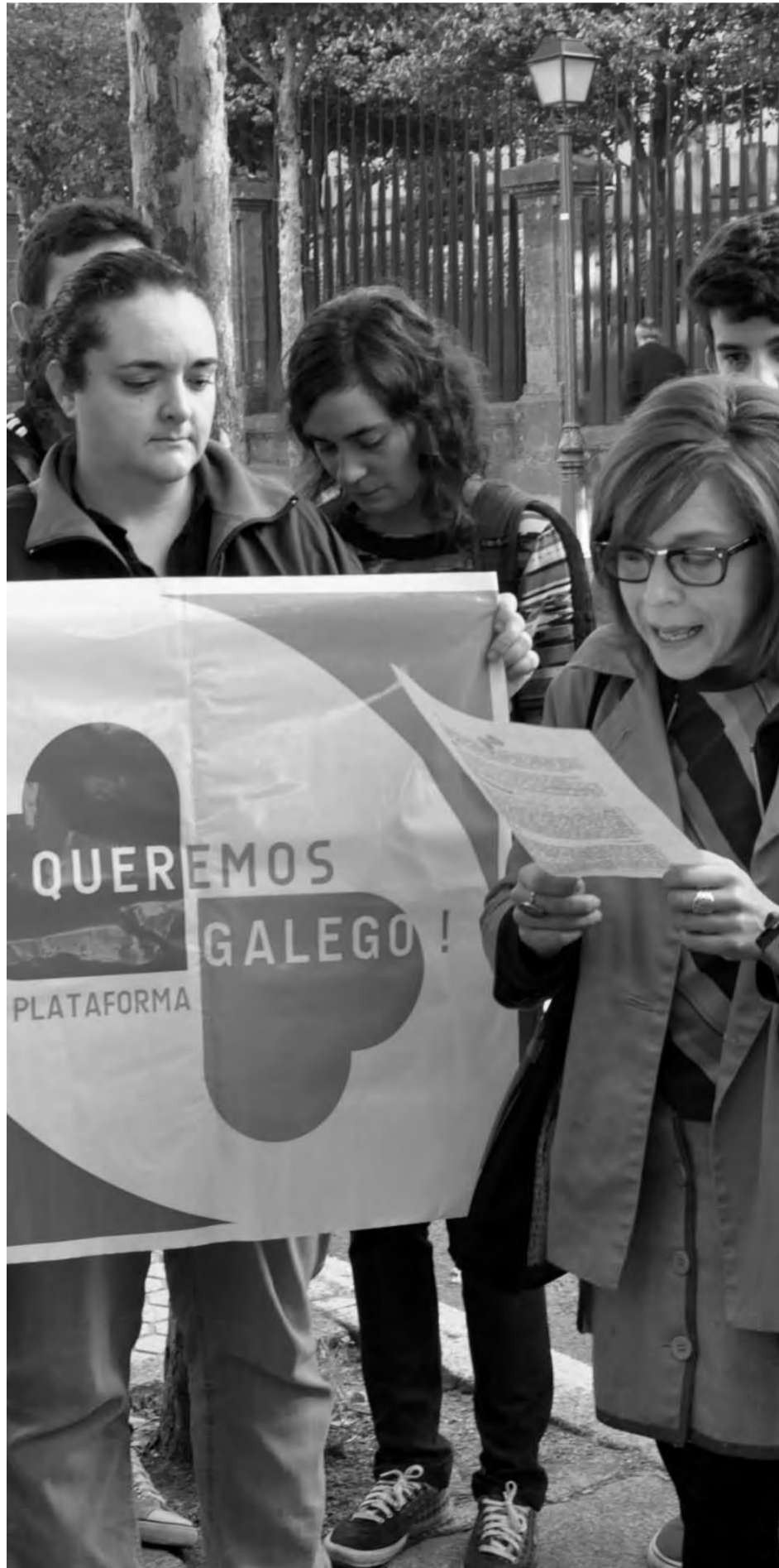
Lectura pública do manifesto "Por un compromiso real e efectivo co PXNLG" diante do Parlamento.

Como resposta a esta actitude, o pasado 22 de outubro unha representación da Plataforma cidadá Queremos Galego fixo lectura pública do "Manifesto por un compromiso real e efectivo co Plan Xeral de Normalización da Lingua Galega" ás portas do Parlamento de Galiza, denunciando o cinismo da Xunta que evidenciaba